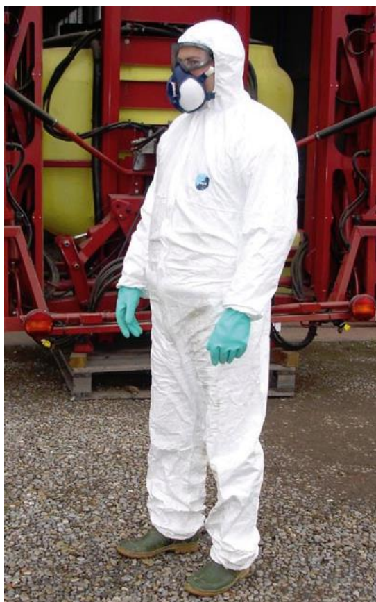
Immagine tratta da http://lineeguida.iambientale.it/

RICORDIAMO ANCORA UNA VOLTA L'UTILIZZO DI MASCHERE PROVviste DI FILTRI (cat. III), OCCHIALI (cat.III), TUTA (cat. III – tipi 3,4,5,6) E GUANTI (cat.III).