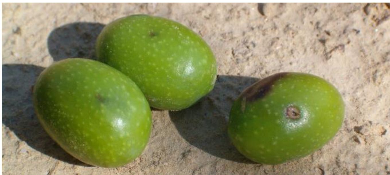
Figura 1: A sx: olive con deposizione di Bactrocera olea , sezionando l'oliva si possono individuare uova o larve. A dx: oliva con foro di sfarfallamento, in questo caso il ciclo della mosca si è completato e l'oliva è destinata a cadere.