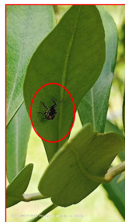
Neanide di III età- Valtenesi

Nel caso di alta presenza dell'insetto si consiglia agli olivicoltori di segnalare la situazione con una mail o telefonicamente ai tecnici.