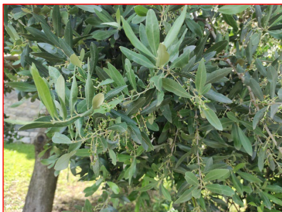
Fase fenologica rilevata - areale sebino