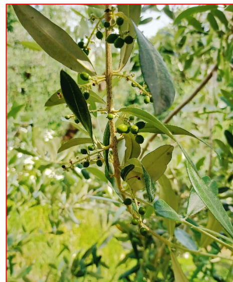
Fase fenologica attuale- Valtinesi