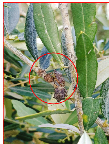
Adulti di cimice asiatica