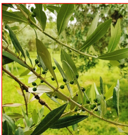
Fase fenologica attuale-Alto Garda