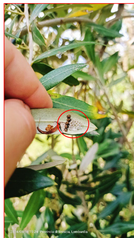
Ovatura di cimice asiatica con neanidi di I Età- Alto Garda